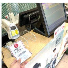
カード会員証の方

セルフチェックイン・アウトとなりますので、会員証またはケータイアプリのご用意ください。専用の端末にバーコードを読ませ、画面の「チェックイン」をタッチしてください。無人営業時間は出入口ICカードリーダーにてチェックインとなります。