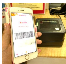
会員証アプリの方